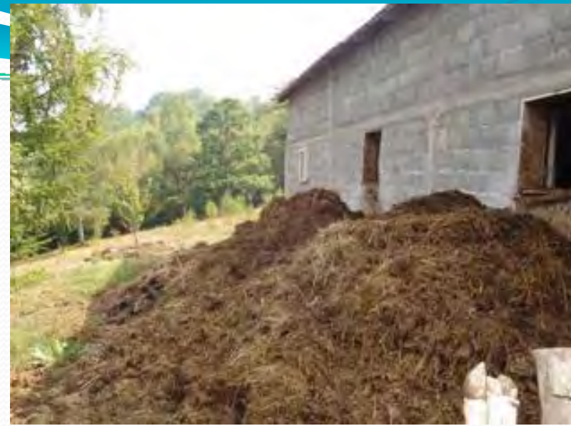
Nepravilno skladištenje stajnjaka