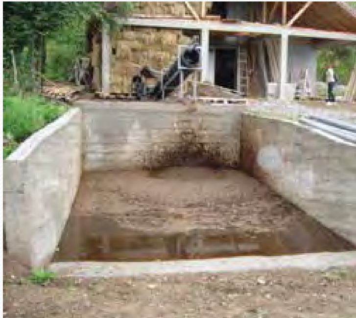
Pravilno skladištenje stajnjaka